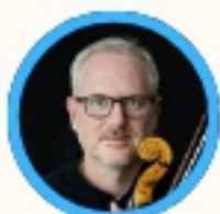
Saverio Ruol Ruzzini